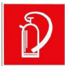
Hinweisschild "Merkblatt für Brandbekämpfung im Bereich elektrischer Anlagen" Größe 600 x 400 mm x 1 mm