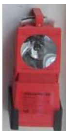
Handnotleuchte (Abb. ähnlich) mit NC-Akku mit automatischem Ladegerät mit Anschlussstecker an eine Schuko Steckdose 220V, mit Wandhalterung